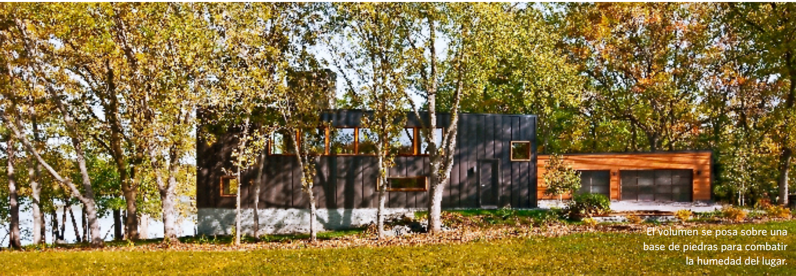
El volumen se posa sobre una base de piedras para combatir la humedad del lugar.